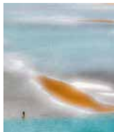
Solitudes de l'Estran © Francis Bacon

Exposition, photo. Avec Les Éléments climatiques , le regard des photographes restitue un témoignage de notre monde bercé par ses différents climats. Dans Solitudes de l'Estran , Francis Bacon parvient à saisir le sens et les dimensions de ce qu'il voit. + Visite artistique (ven. 28 à 18h). Du 26/6 au 7/7