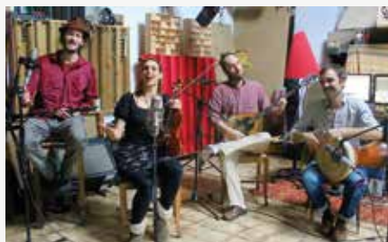
Meskaj Quartet