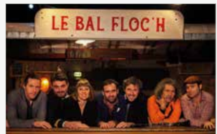
La Nouvelle Collection

Prends-en de la graine par la Cie Les Miscellanées, burlesque interactif (15h, parc de la médiathèque de l'IC). Studio photo "Sauvage !" de Jeanne Paturel (16h-22h). OBAKE par le Collectif Maison Courbe, cirque & danse (17h30, cour de La Ville Robert puis déambulation dans la ville. Dès 7 ans). Le Bal Floch par La Nouvelle Collection, bal forain des musiques du monde (20h30, cour de La Ville Robert). Sam. 15 dès 15h