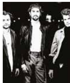
Bleu Pétrale

Scène ouverte (17h-19h30), concert de Bleu Pétrale, rock contemporain en français (dès 20h), suivi de DJ Victoric Leroy. Org. Ville. Ven. 14 dès 17h, centre-ville. Gratuit