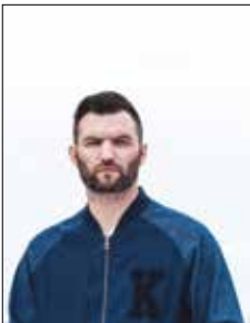
ARM © DR

Le bar du Sew vous accueille pour une cool soirée entre rap et DJ set calibrée pour célébrer l'été qui approche. Tout y passe du moment que ça fait danser. C'est frais, piquant et ensoleillé! Sam. 8 à 21h. Gratuit